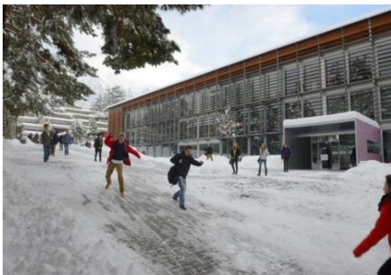
EC SPORT BRIG